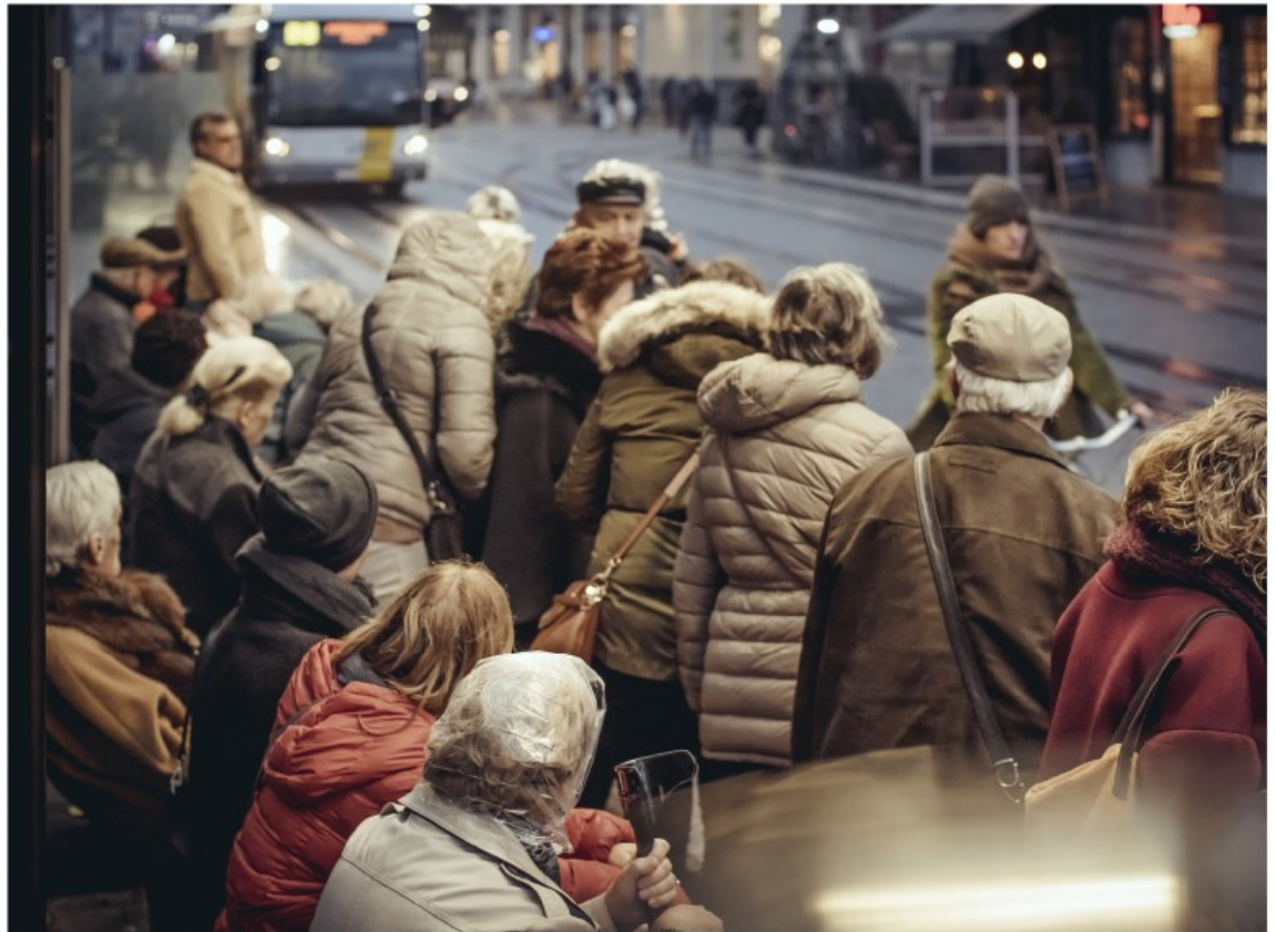
Elk jaar vloeit er meer dan twee miljard euro vanuit Wallonië en vooral Brussel naar de Vlaamse pensioenen.

De recente daling heeft alles te maken met de snel vergrijzende Vlaamse bevolking, een trend die nog decennia zal aanhouden. In Wallonië zijn er nog meer minderjarigen dan 65-plussers, in Vlaanderen niet. Elk jaar vloeit er meer