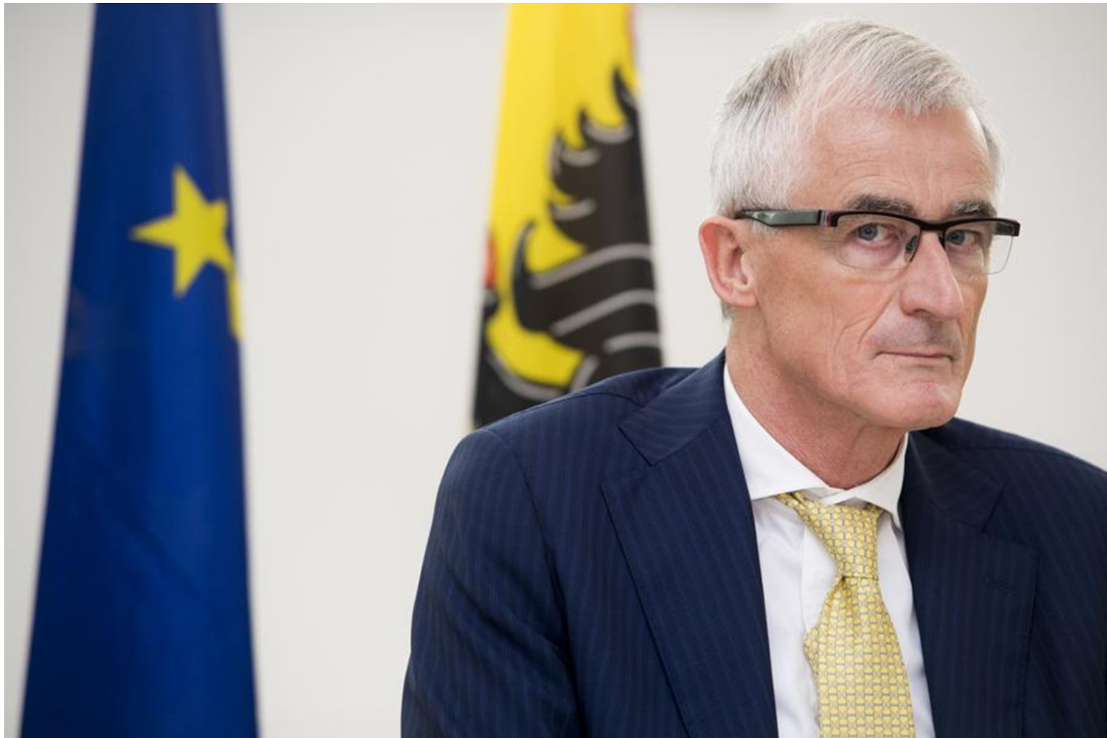
Minister-president Geert Bourgeois (N-VA) droomt van wat de Vlaamse regering met het transferegeld zou kunnen aanvangen.

Tussen 2014 en 2020 dalen de transfers van Vlaanderen naar Wallonië en Brussel van 7,1 miljard naar 6,6 miljard euro. Dankzij de zesde staatshervorming.